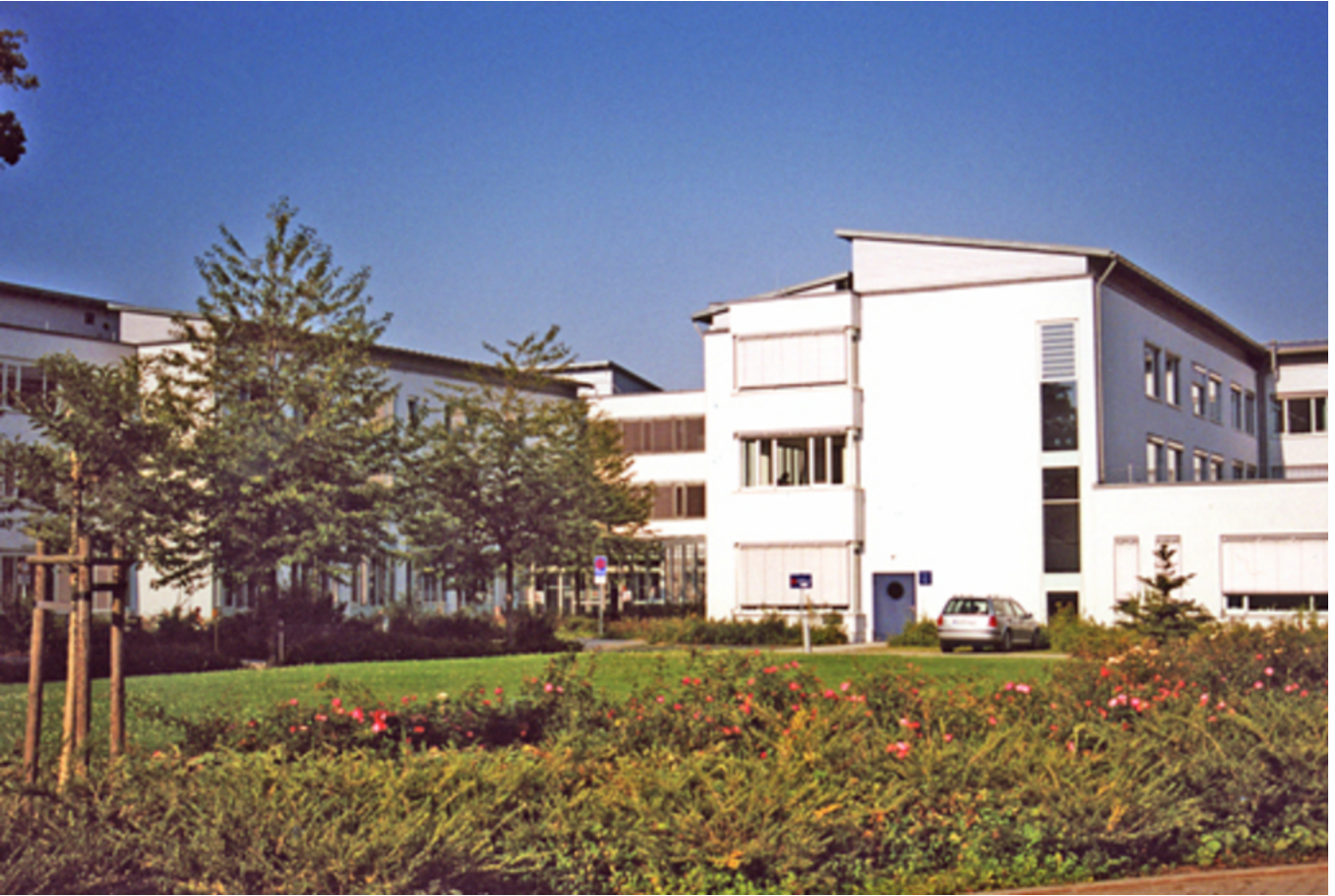
Abbildung: Krankenhaus Bischofswerda der Oberlausitz-Kliniken gGmbH