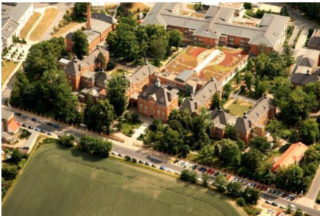
Abbildung: das Klinikum Görlitz von oben

Das Motto „Kompetenz und Zuwendung“ bündelt die Intentionen des Leitbildes der Städtisches Klinikum Görlitz gGmbH, die in der Praxis in fünf strategischen Zielen umgesetzt werden: