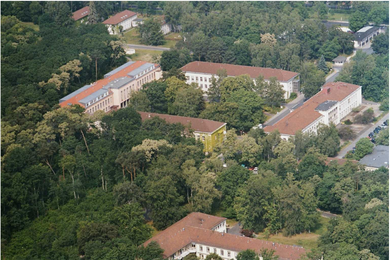
Abbildung: Das Gemeinschaftskrankenhaus Havelhöhe liegt am südwestlichen Stadtrand von Berlin in einem großen Parkgelände.

Die 1950 als „Landestuberkulosekrankenhaus“ gegründete Klinik gehörte bis Ende 1994 zum Städtischen Krankenhaus Spandau. Mit der Übernahme der Klinik am 1. Januar 1995 durch den „Gemeinnützigen Verein zur Förderung und Entwicklung anthroposophisch erweiterter Heilkunst e.V. Berlin“, begann der Umgestaltungsprozess zum „Gemeinschaftskrankenhaus Havelhöhe“. Rund 600 Mitarbeiterinnen und Mitarbeiter haben in den vergangenen 14 Jahren engagiert an der Entwicklung unseres Hauses zur „Klinik für Anthroposophische Medizin“ mitgewirkt.