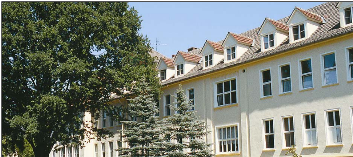
KMG Klinikum Kyritz