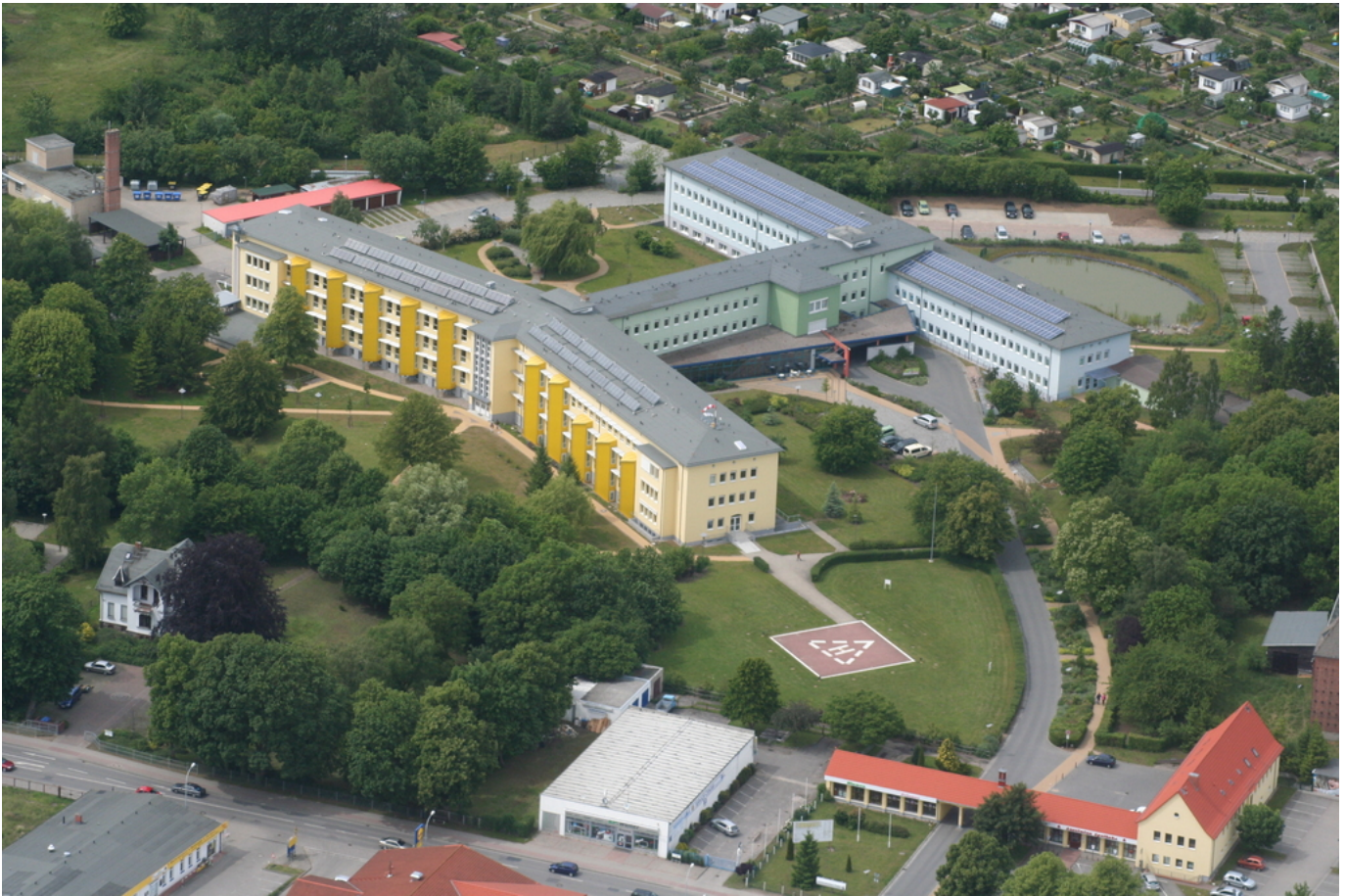
Abbildung: Kreiskrankenhaus Wolgast gGmbH

Die Kreiskrankenhaus Wolgast gGmbH ist ein Krankenhaus der Grund- und Regelversorgung. Hauptgesellschafter der gGmbH ist das Universitätsklinikum der Hansestadt Greifswald, Minderheitsgesellschafter der Landkreis Ostvorpommern.