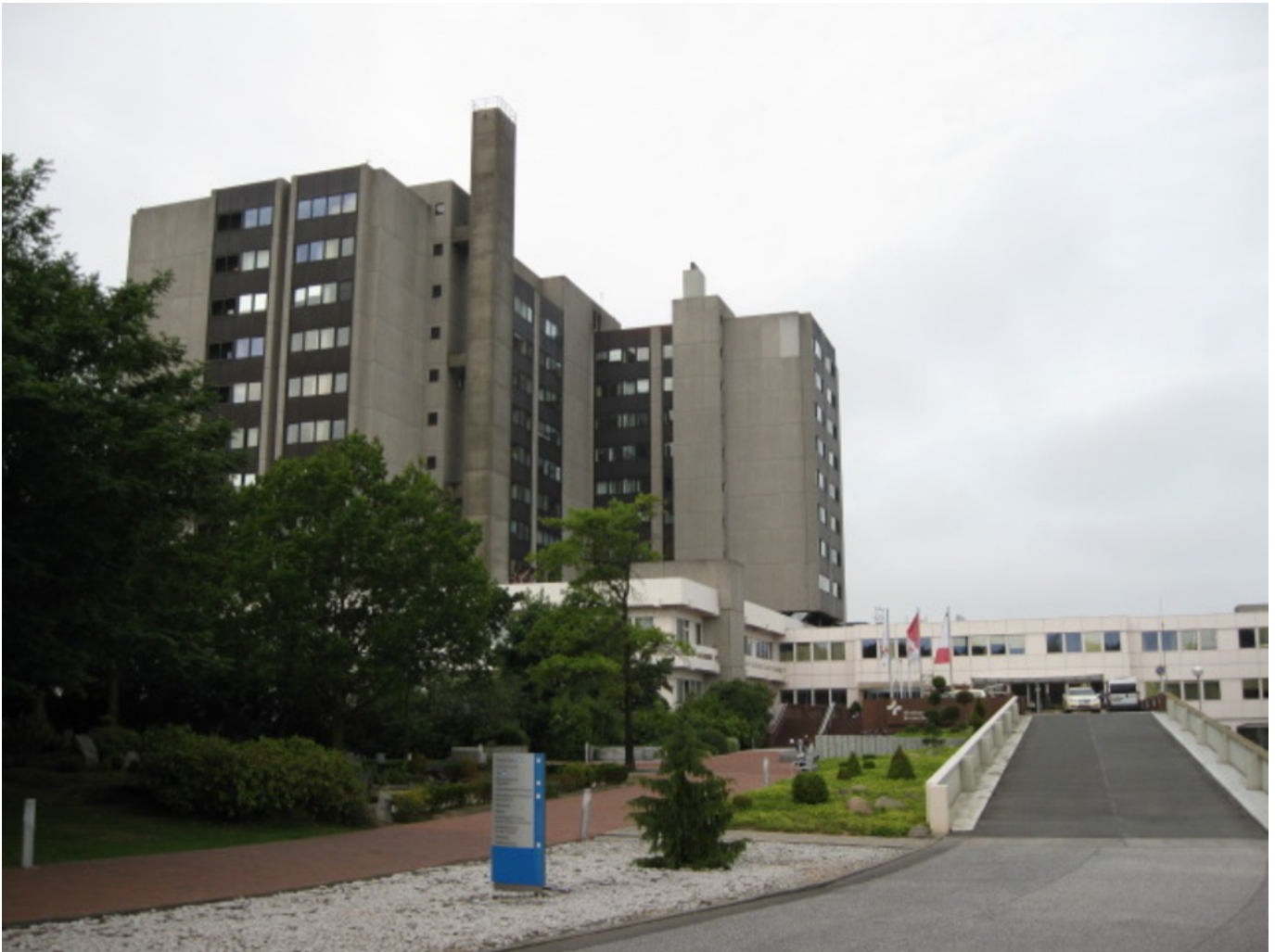
Abbildung: Bild des Klinikums.