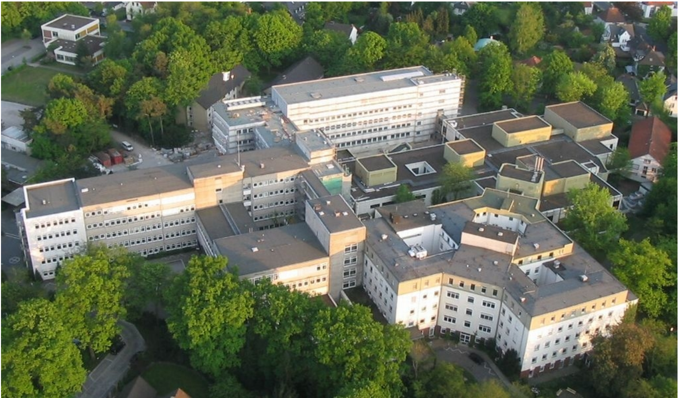
Abbildung: Das Städtische Klinikum Gütersloh aus der Luft

Das Städtische Klinikum Gütersloh ist als regionales Schwerpunktkrankenhaus das größte Akut-Krankenhaus im Kreis Gütersloh. An zwei Standorten werden in 468 Betten über 18.000 Patientinnen und Patienten jährlich stationär behandelt. Durch ambulante Operationen, die Institutsambulanz des Krankenhauses und die ambulanten Ermächtigungen der Chefarzte werden außerdem über 33.000 Patienten jährlich ambulant versorgt. Die steigende Tendenz zu mehr Patienten (sowohl stationär als auch ambulant) hat sich damit auch im Jahr 2008 fortgesetzt. Das Bemühen um bestmögliche Qualität in der medizinischen und pflegerischen Patientenversorgung verbunden mit der bestmöglichen Diagnostik und Therapie verpflichtet uns, alle uns zur Verfügung stehenden Kompetenzen zum Wohle unserer Patientinnen und Patienten einzusetzen.