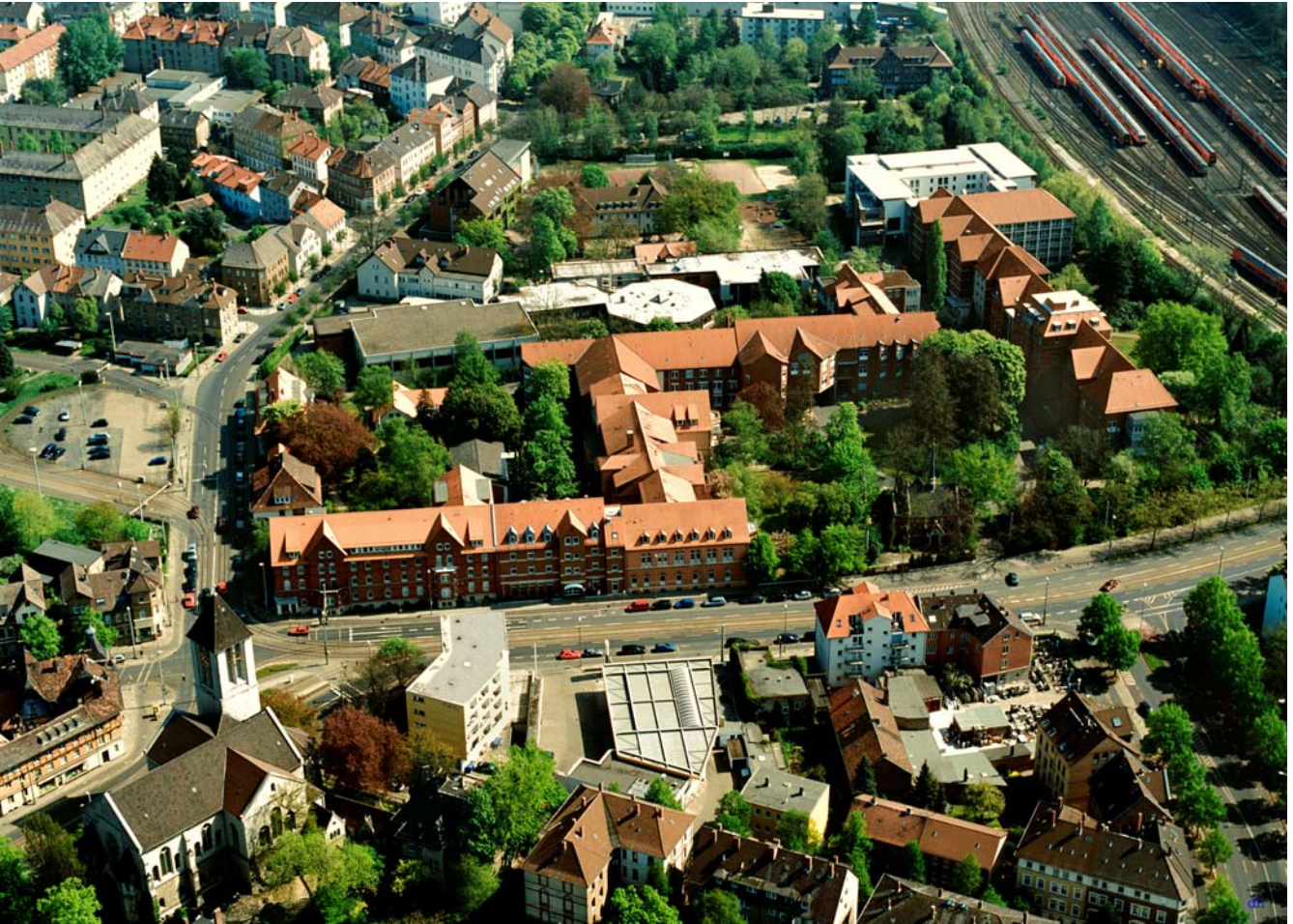
Abbildung: Ev.-luth. Diakonissenanstalt Marienstift in der Übersicht

Das Krankenhaus des Marienstiftes ist ein evangelisches Krankenhaus der Grundversorgung mit verschiedenen Kliniken und Funktionsbereichen: