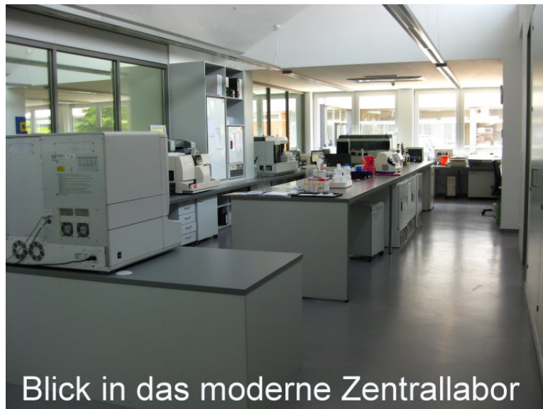
Blick in das moderne Zentrallabor

Zur Verbesserung der Wirtschaftlichkeit, Stärkung der Leistungsfähigkeit, zum Ausbau der Leistungsangebote sowie zur Vernetzung der Krankenhausleistungen mit Vorsorge- und Rehaeinrichtungen, Alten- und Pflegeheimen und Ambulanten Pflegediensten, schlossen sich die Krankenhäuser Wilhelm-Anton-Hospital gGmbH Goch, St.-Antonius-Hospital gGmbH Kleve, St.-Nikolaus-Hospital gGmbH Kalkar und Marienhospital gGmbH Kevelaer am 01.01.2003 zum Verbund der Katholischen Kliniken im Kreis Kleve Trägergesellschaft mbH Kleve , mit einem Aufsichtsrat und einer Geschäftsführung für alle Einrichtungen, werden heute vier Krankenhäuser, fünf Alteneinrichtungen, ein Mutter-Kind-Kurhaus, zwei Ambulante Pflegedienste, zwei Service-Gesellschaften, Ausbildungsstätten für Kranken- und Kinderkrankenpflege, ein modernes Zentrallabor mit Blutbank sowie eine Krankenhausvollapotheke betrieben.