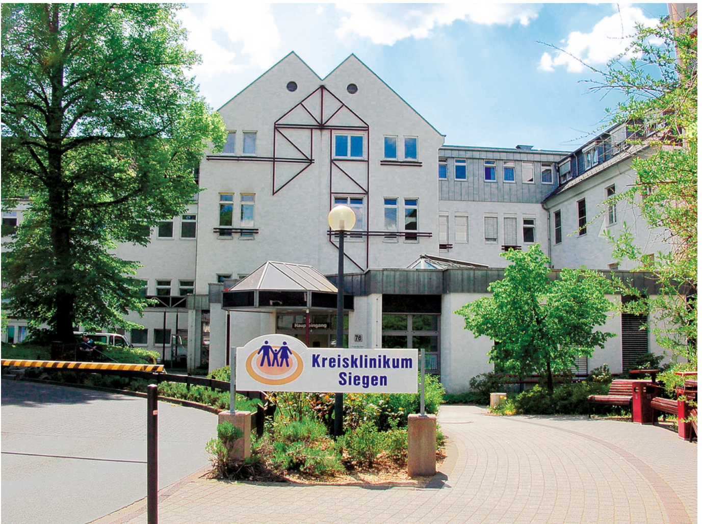
Abbildung: Ansicht Haus Hüttental