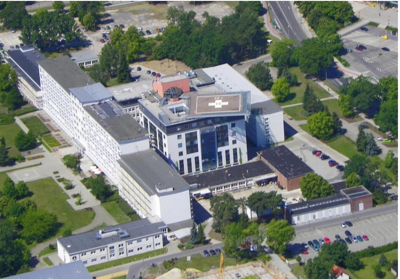
Abbildung: Luftaufnahme Klinikum Hoyerswerda gemeinnützige GmbH