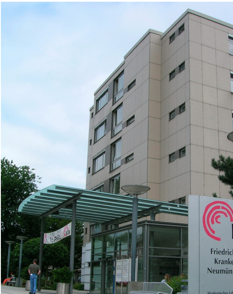
Abbildung: Friedrich-Ebert-Krankenhaus Neumünster

ärztlich versorgt und auch im medizinischen Controlling eng kooperiert.