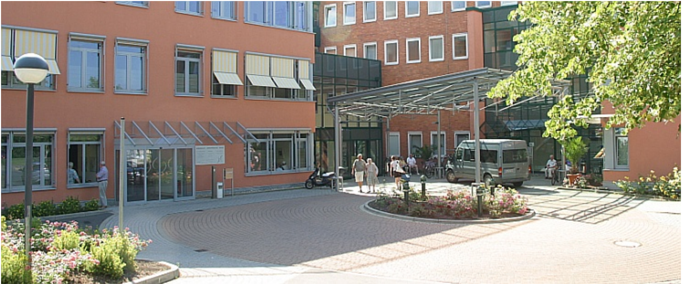
Abbildung Krankenhaus Alfeld - Betriebs-gGmbH

Das Krankenhaus Alfeld sichert die medizinische Versorgung der Bevölkerung des südlichen Landkreises Hildesheim auf hohem Niveau. Gemeinsam mit den Vertragsärzten am Krankenhaus und in der Region sind wir das Gesundheitszentrum des Leineberglands.