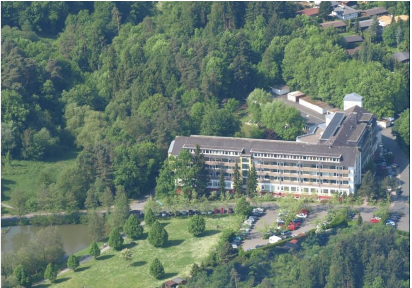
Abbildung: Zu sehen ist die Orthopädische Klinik, eingebettet in Park- und Grünanlagen in einer sehr ruhigen Lage am Rande der Kurstadt Braunfels, die als anerkannter Luftkurort im Norden des Taunus gelegen, bekannt ist.