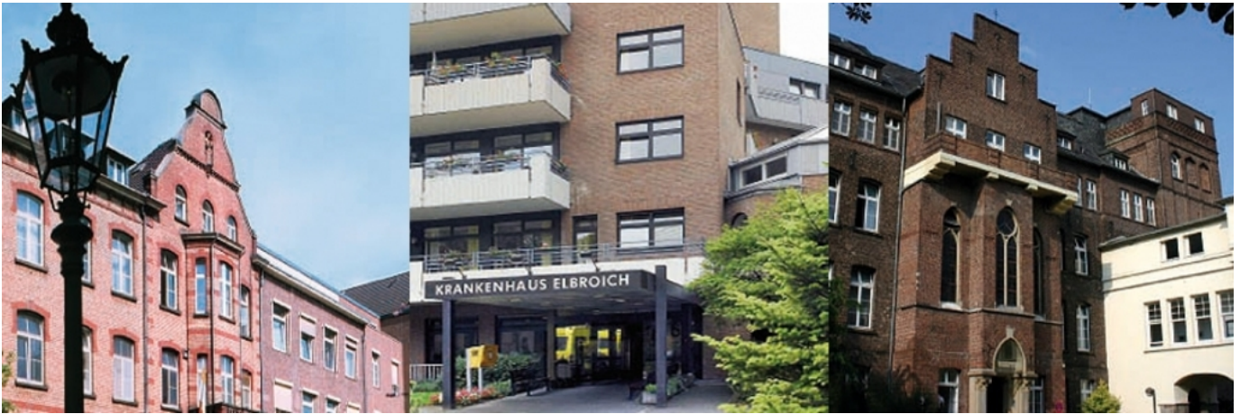
Abbildung: Einrichtungen der Krankenhaus Mörsenbroich-Rath GmbH

Die Krankenhaus Mörsenbroich-Rath GmbH gehört seit 2003 dem Verbund katholischer Kliniken Düsseldorf (VKKD) bei.