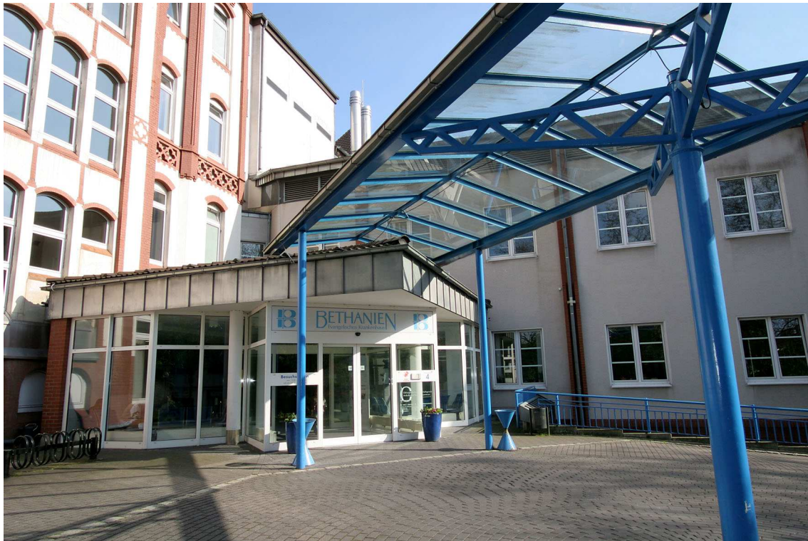
Unser barrierefreier Eingangsbereich

Das Evangelische Krankenhaus Bethanien ist ein Haus der Grundversorgung mit 145 Betten, das sich in die Fachabteilungen Innere Medizin, Orthopädie mit integrierter Unfallchirurgie und Anästhesie gliedert. Es verfügt über einen 24-Stunden Notfalldienst sowie über 7 integrierte Intensivbetten.