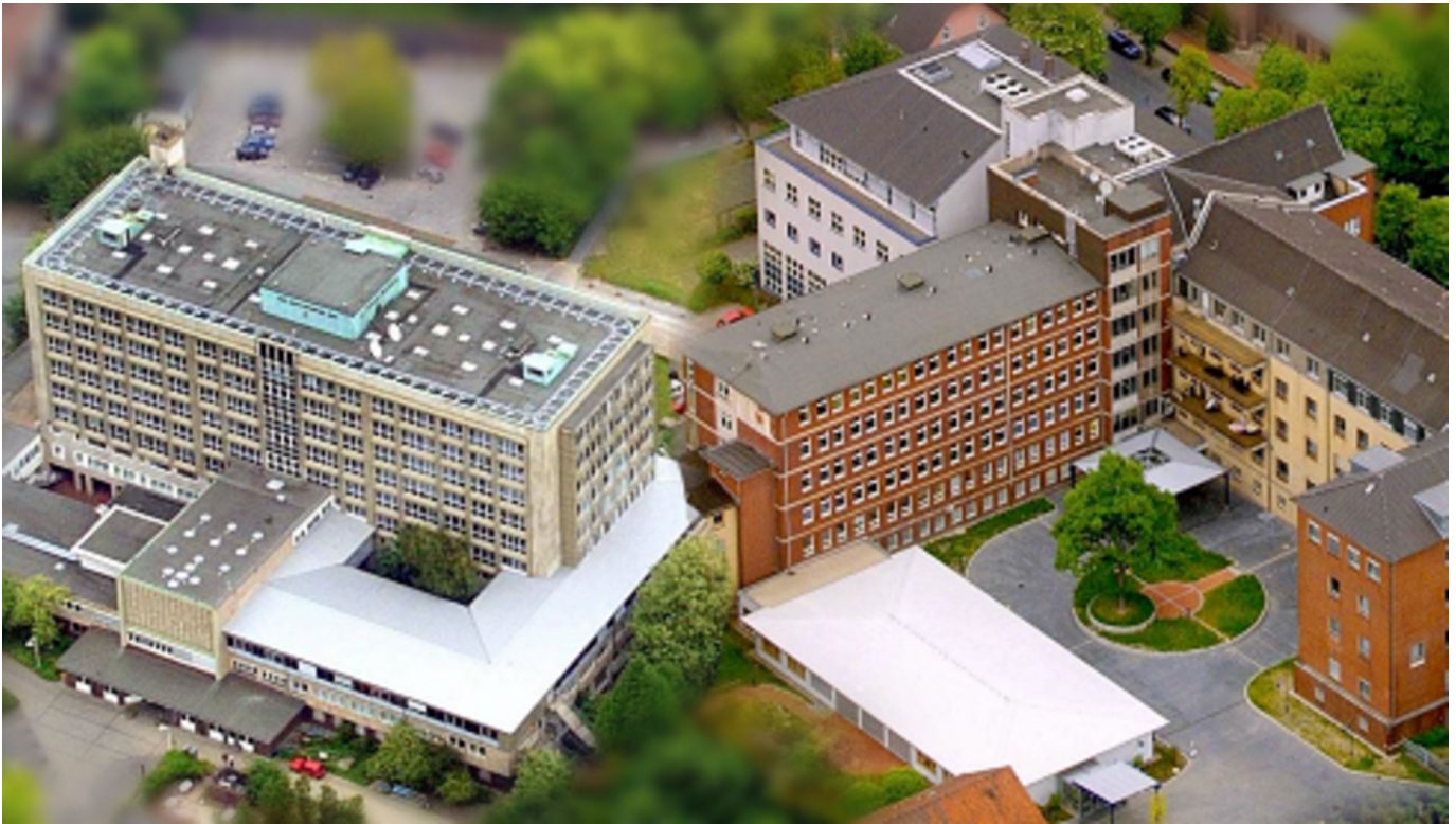
Abbildung: Bild der Einrichtung

Die Stiftung Katholisches Krankenhaus Marienhospital Herne, Klinikum der Ruhr-Universität Bochum, ist ein modernes Krankenhaus der Maximalversorgung mit zwei Betriebsstätten im Stadtgebiet. Im Jahr 1977 erhielt das Marienhospital mit seinen Kliniken und Abteilungen universitären Status und bildet seitdem mit drei weiteren Krankenhäusern das Klinikum der Ruhr-Universität. Der Träger des Krankenhauses ist die Stiftung Katholisches Krankenhaus Marienhospital Herne. Die Stiftung Katholisches Krankenhaus Marienhospital Herne versorgt jährlich über 20.000 Patienten und verfügt über 575 Planbetten. Mehr als 34.000 Patienten werden jährlich ambulant betreut. Mit rund 1.700 Beschäftigten zählt die Stiftung Marienhospital zu den größten Arbeitgebern der Stadt Herne.