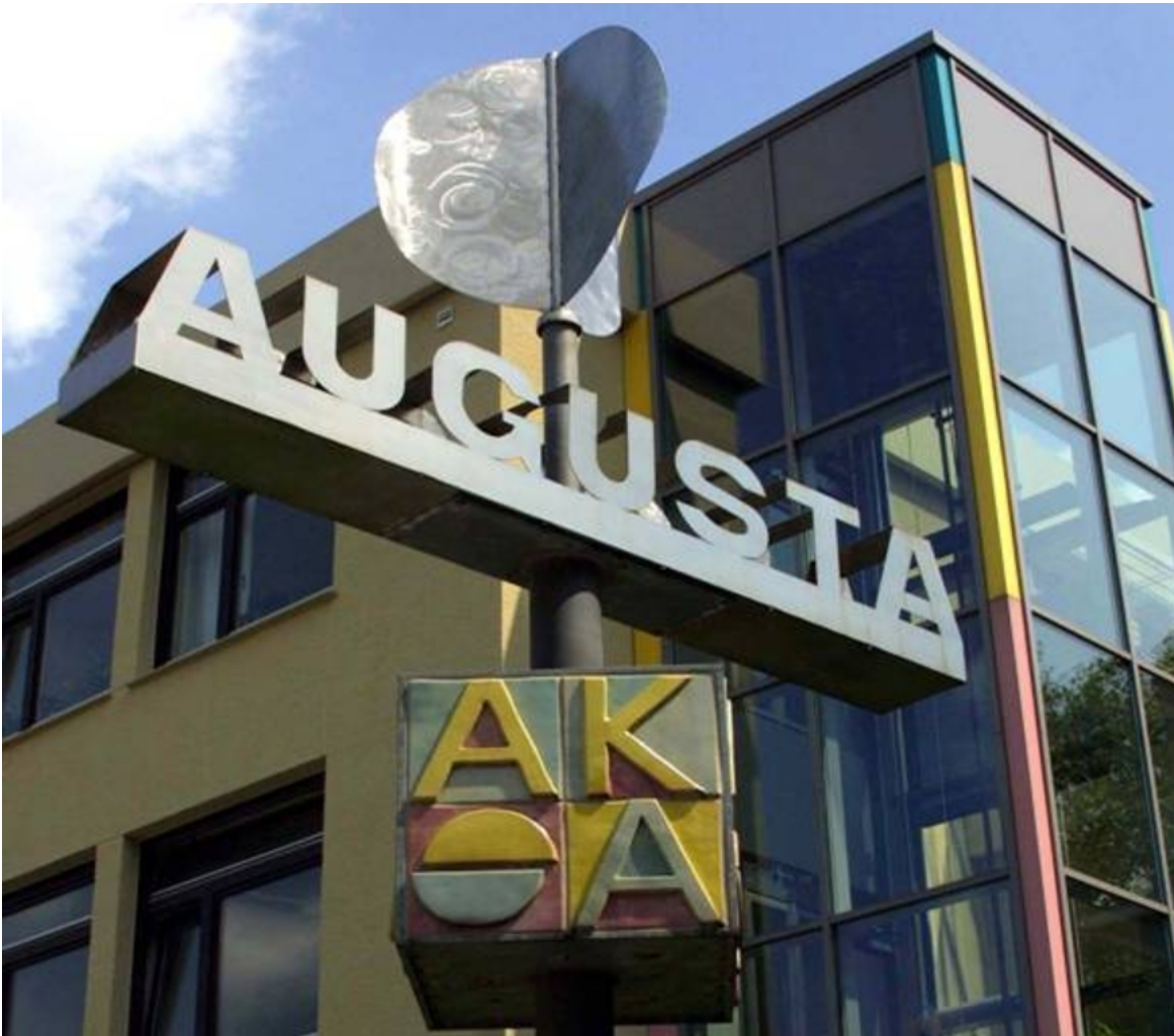
Abbildung: Augusta-Kranken-Anstalt Bochum gGmbH