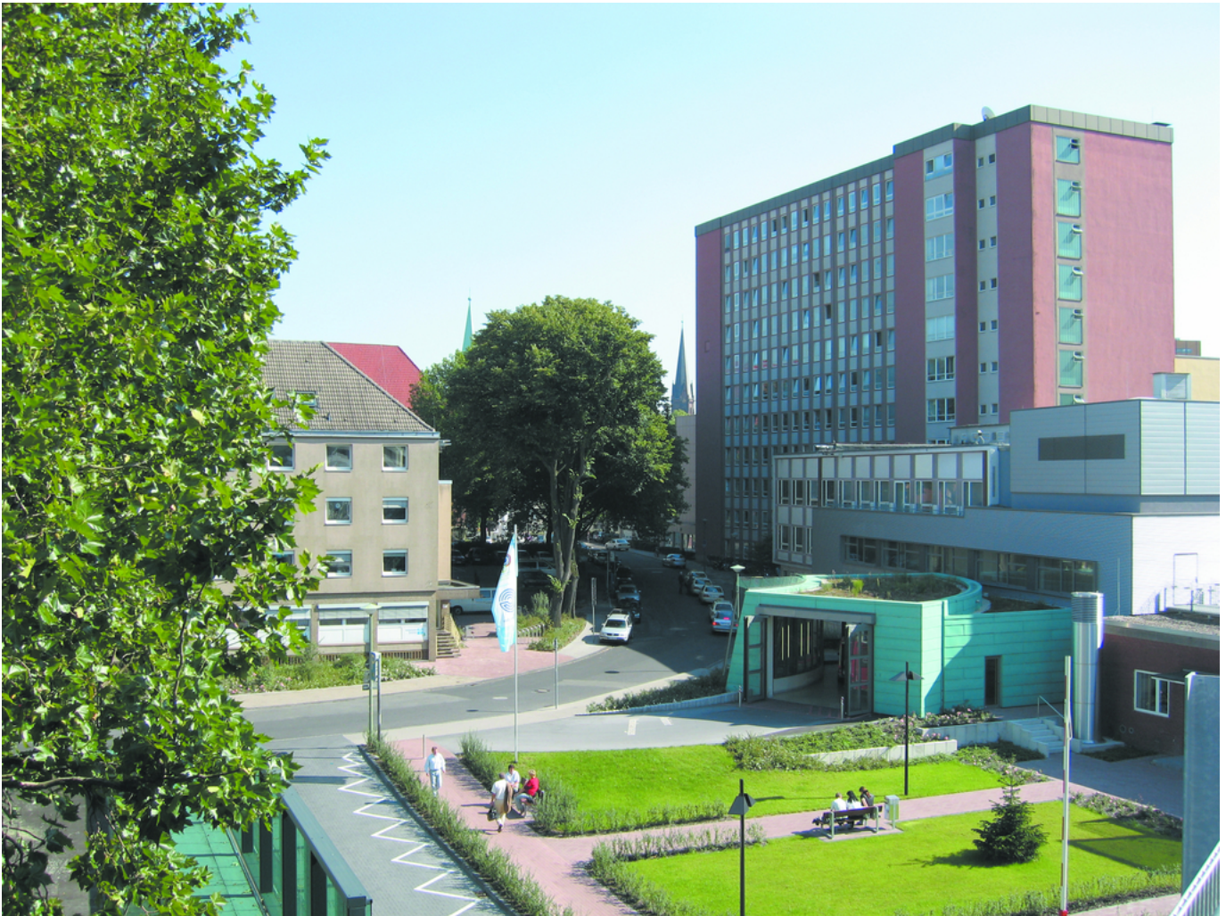
Abbildung: Evangelische Kliniken Gelsenkirchen

Die " Evangelische Kliniken Gelsenkirchen GmbH " (nachstehend EVK GE) ist eine Einrichtung des Diakoniewerkes Gelsenkirchen & Wattenscheid.