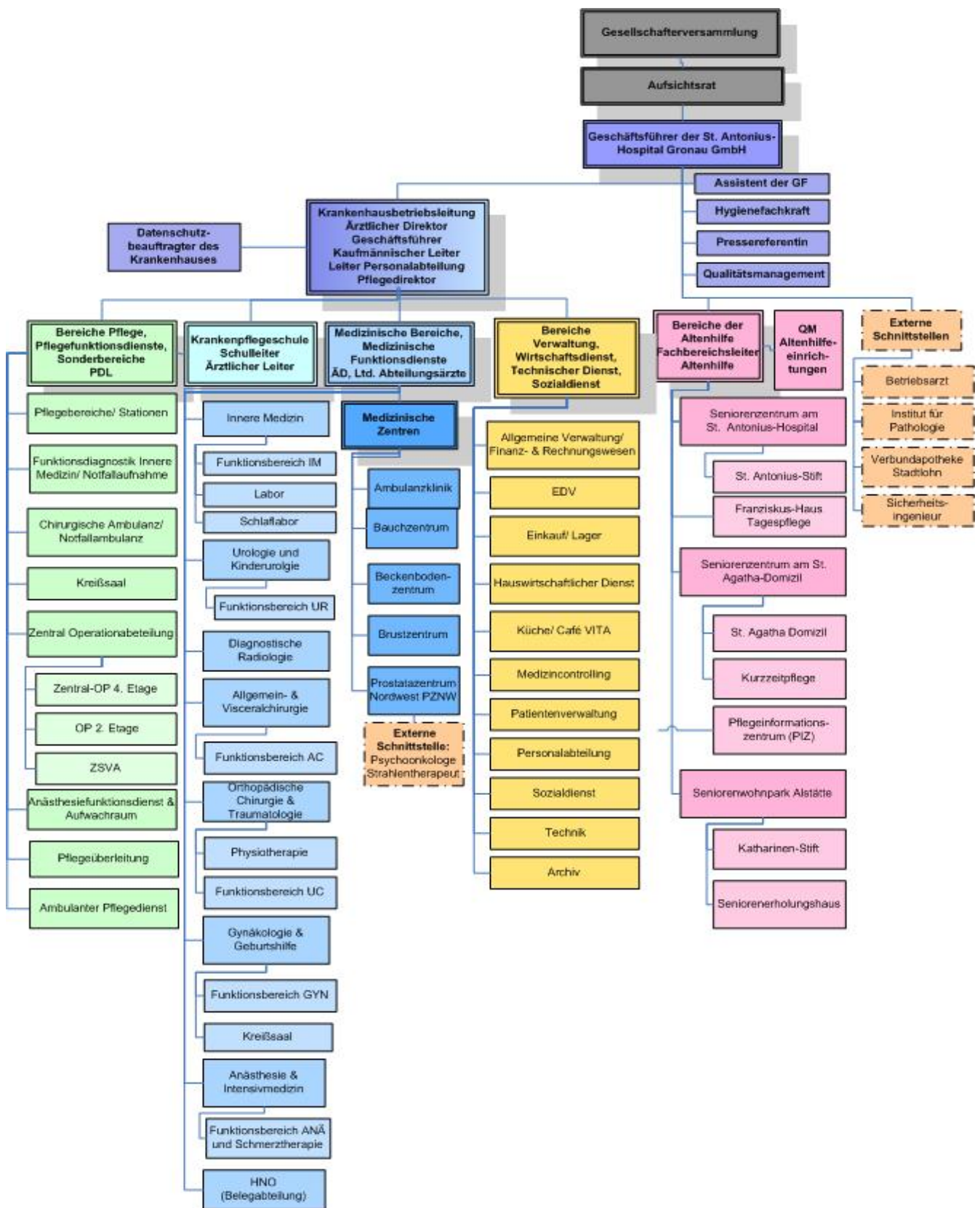
Organigramm: Organigramm des St. Antonius-Hospitals Gronau, Stand August 2009