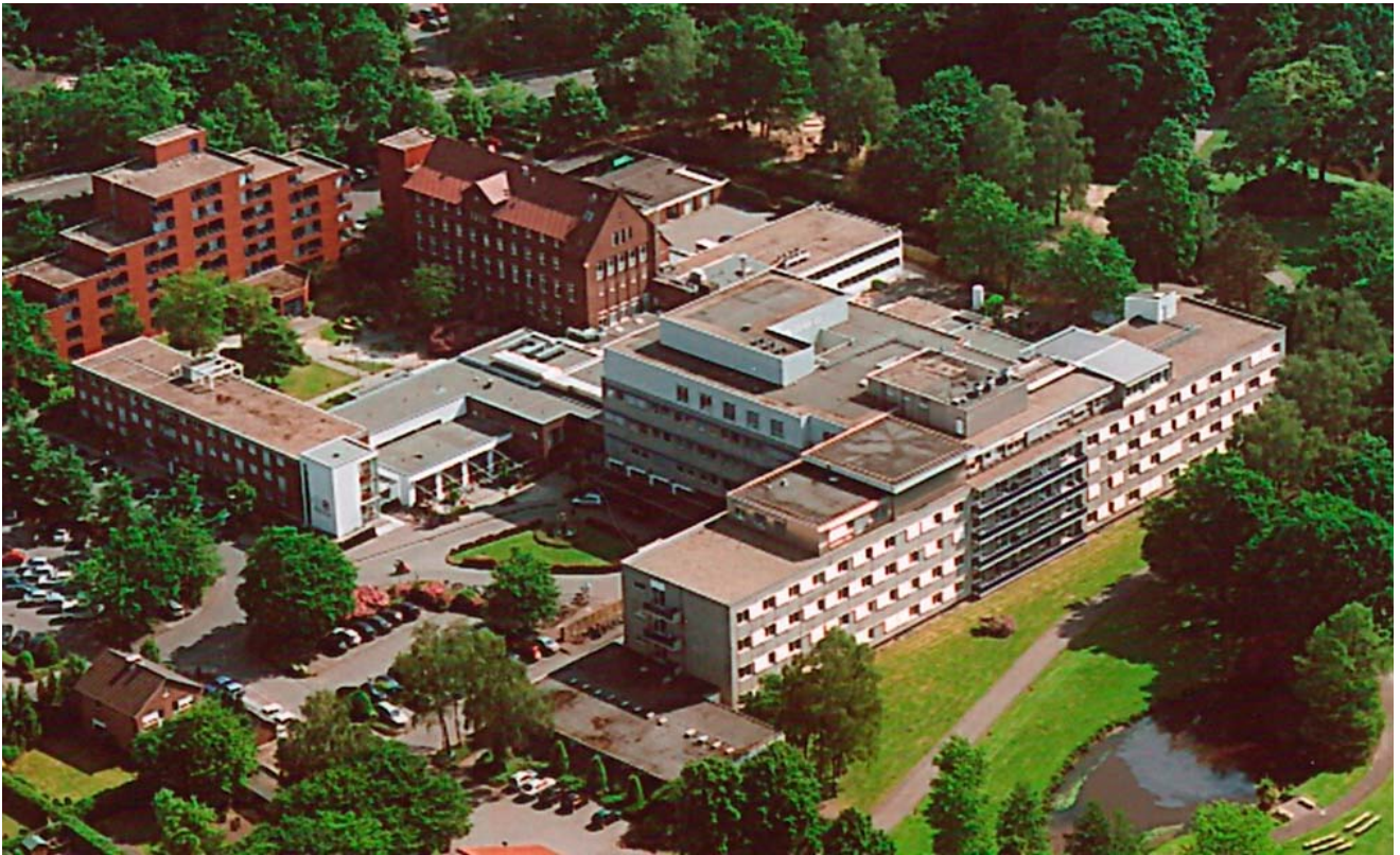
Abbildung: Luftbild des St. Antonius-Hospitals Gronau

Dieser Qualitätsbericht wurde gemäß § 137 SGB V vom St. Antonius-Hospital Gronau erstellt.