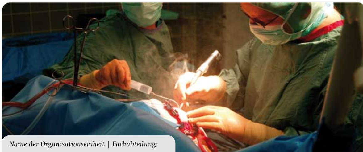
Name der Organisationseinheit | Fachabteilung: