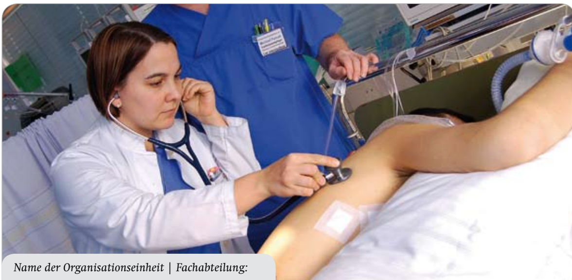
Name der Organisationseinheit | Fachabteilung: