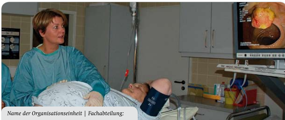
Name der Organisationseinheit | Fachabteilung: