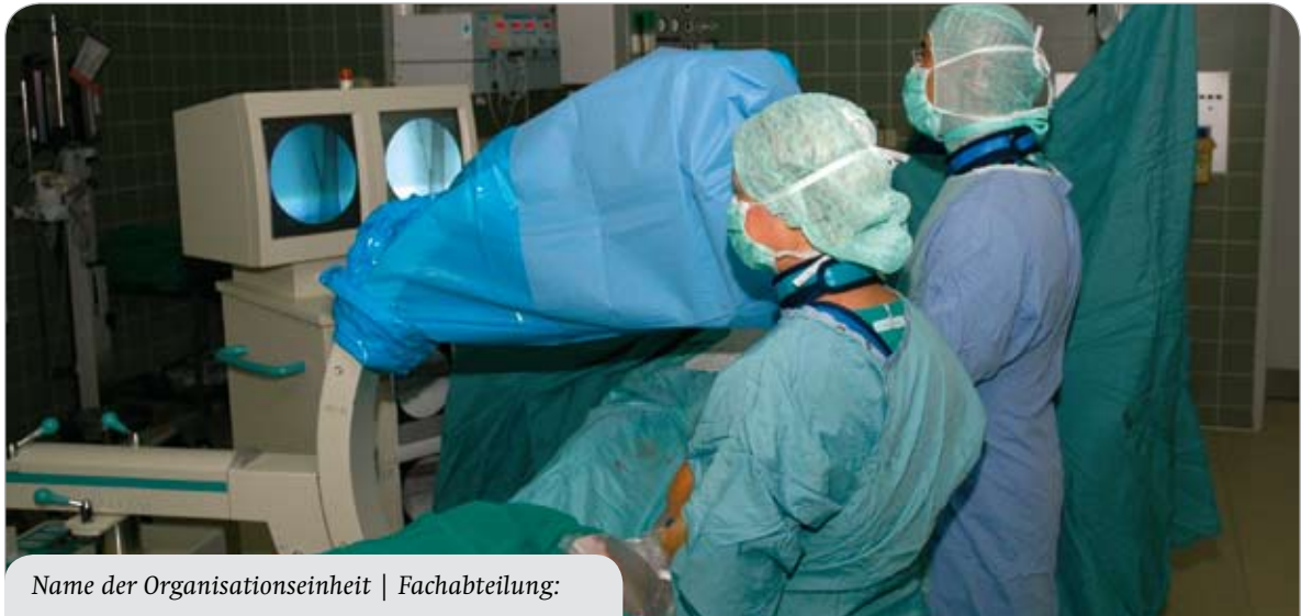
Name der Organisationseinheit | Fachabteilung: