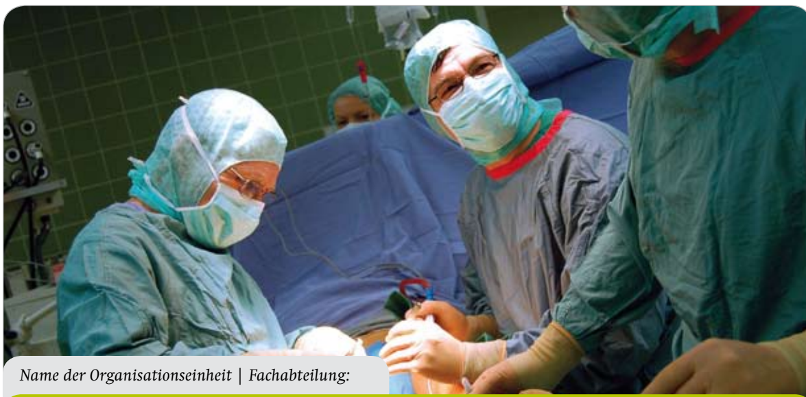
Name der Organisationseinheit | Fachabteilung: