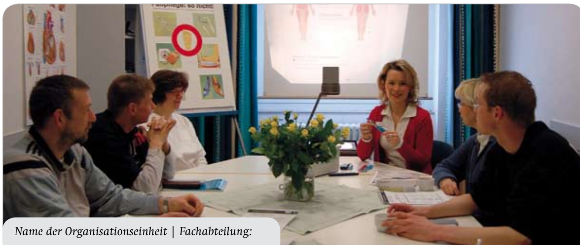
Name der Organisationseinheit | Fachabteilung: