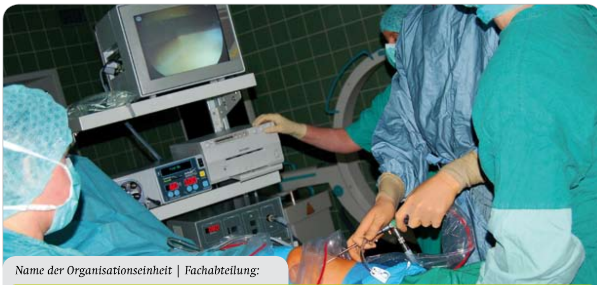
Name der Organisationseinheit | Fachabteilung: