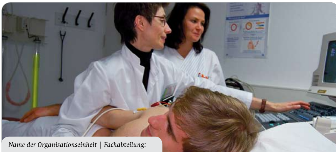
Name der Organisationseinheit | Fachabteilung: