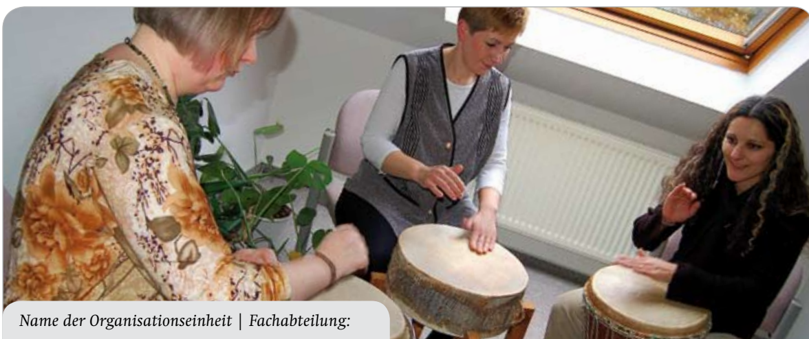
Name der Organisationseinheit | Fachabteilung: