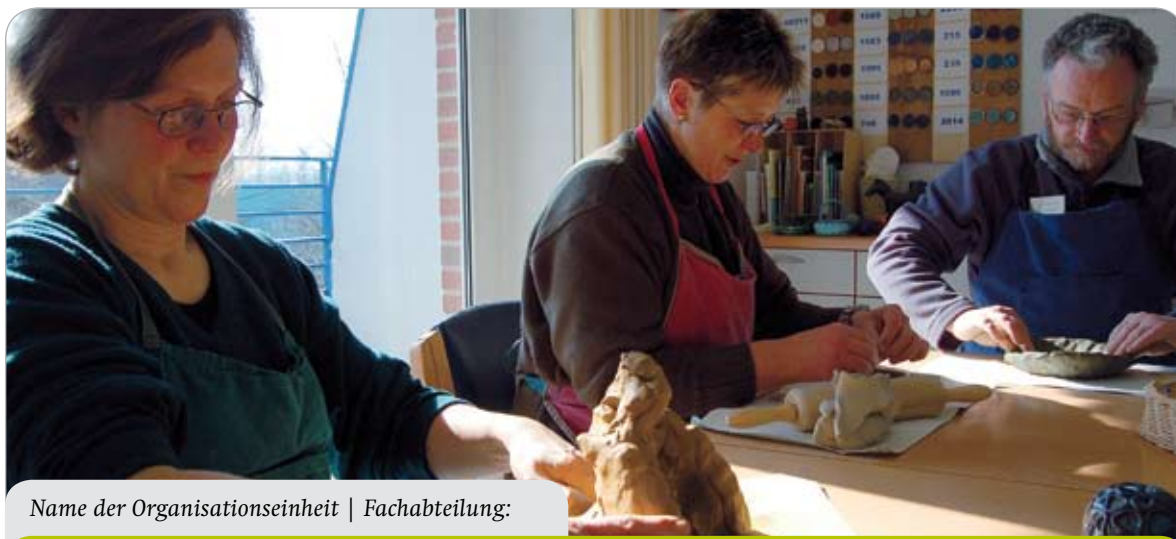
Name der Organisationseinheit | Fachabteilung: