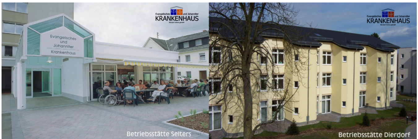
Abbildung: Außenansicht der beiden Betriebsstätten: Eingangsbereich Betriebsstätte Selters mit Cafeteria (linkes Bild) Bettentrakt der Betriebsstätte Dierdorf (rechtes Bild)