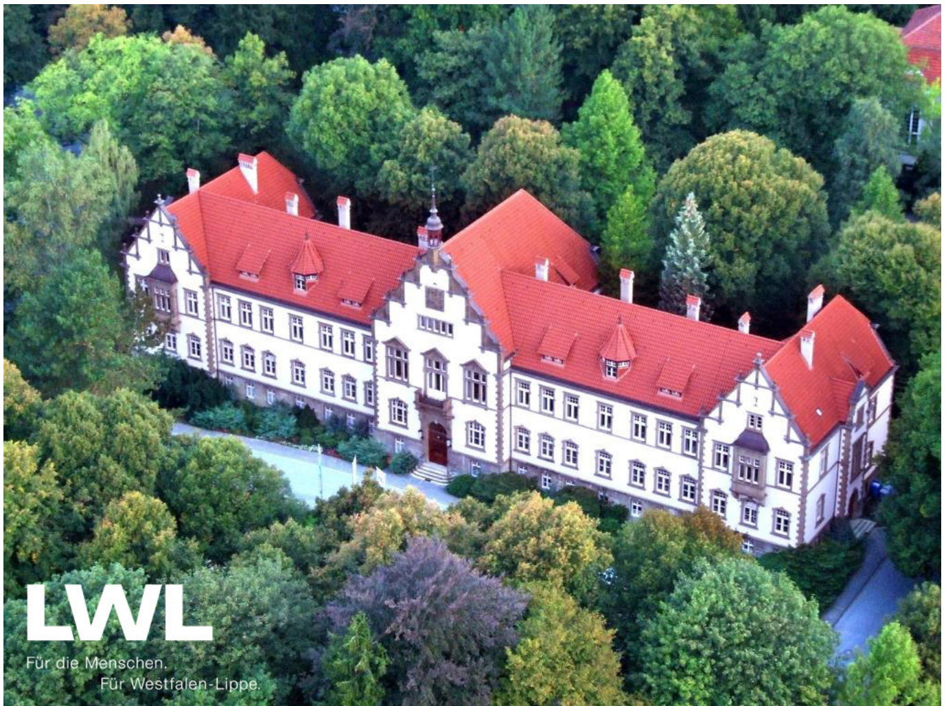
Abbildung: Die LWL-Klinik Warstein - hier ein Luftbild des Verwaltungsgebäudes - liegt inmitten eines öffentlich zugänglichen Parkgeländes am Stadtrand von Warstein