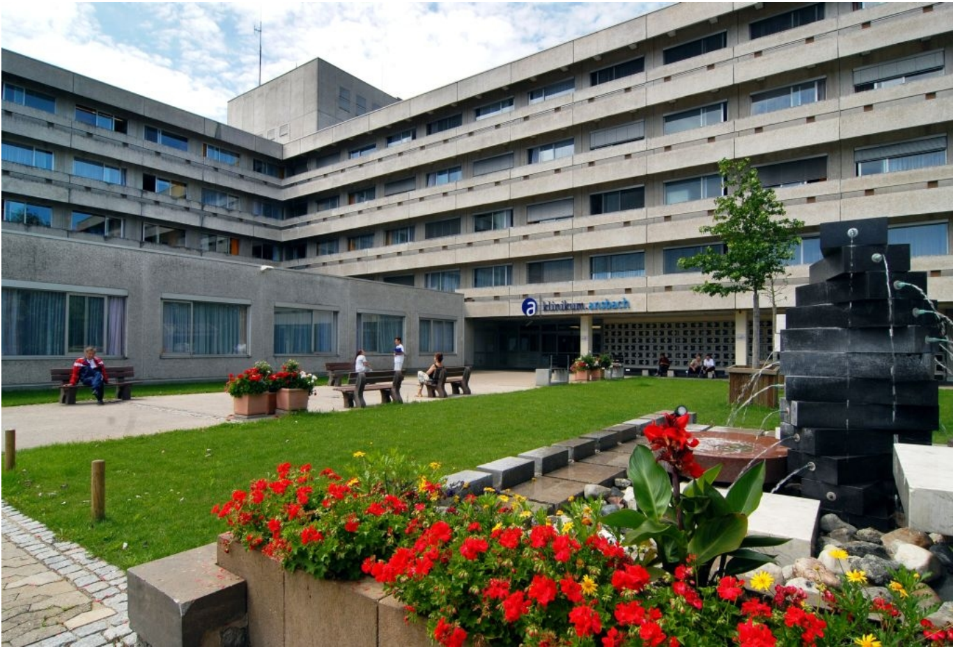
Abbildung: Willkommen im Klinikum Ansbach